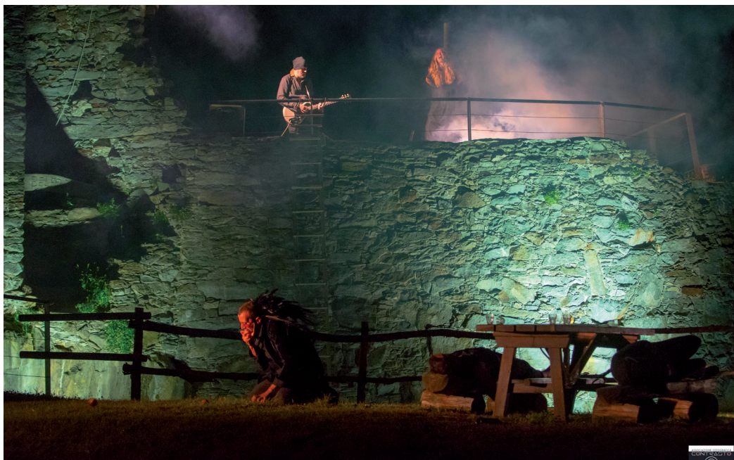
Faust partecipa ad un Sabba di streghe nella “notte di Valpurga” .