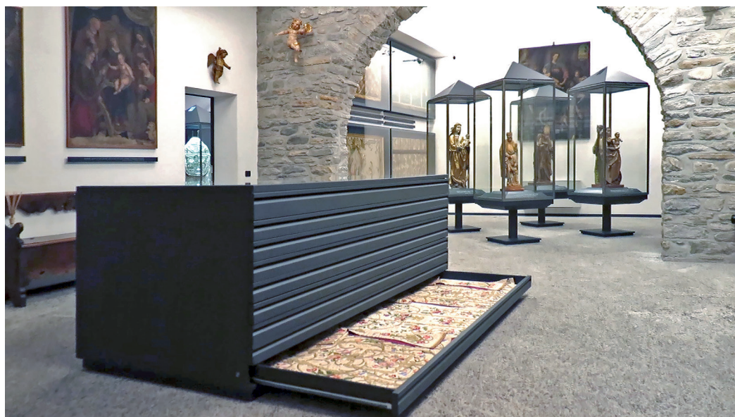
Figura 3: sala interna del Museo del Tesoro con paramenti liturgici e sculture lignee.

ideatori del progetto è che il lavoro sulla mappa di comunità non si concluda quest'anno, ma che prosegua nell'arco dei prossimi anni scolastici in modo tale che, focalizzandosi di volta in volta sulle altre aree del territorio si riesca a coinvolgere un numero sempre più ampio di istituti scolastici e a costruire un archivio multimediale di storie e leggende dell'intera Valchiavenna.