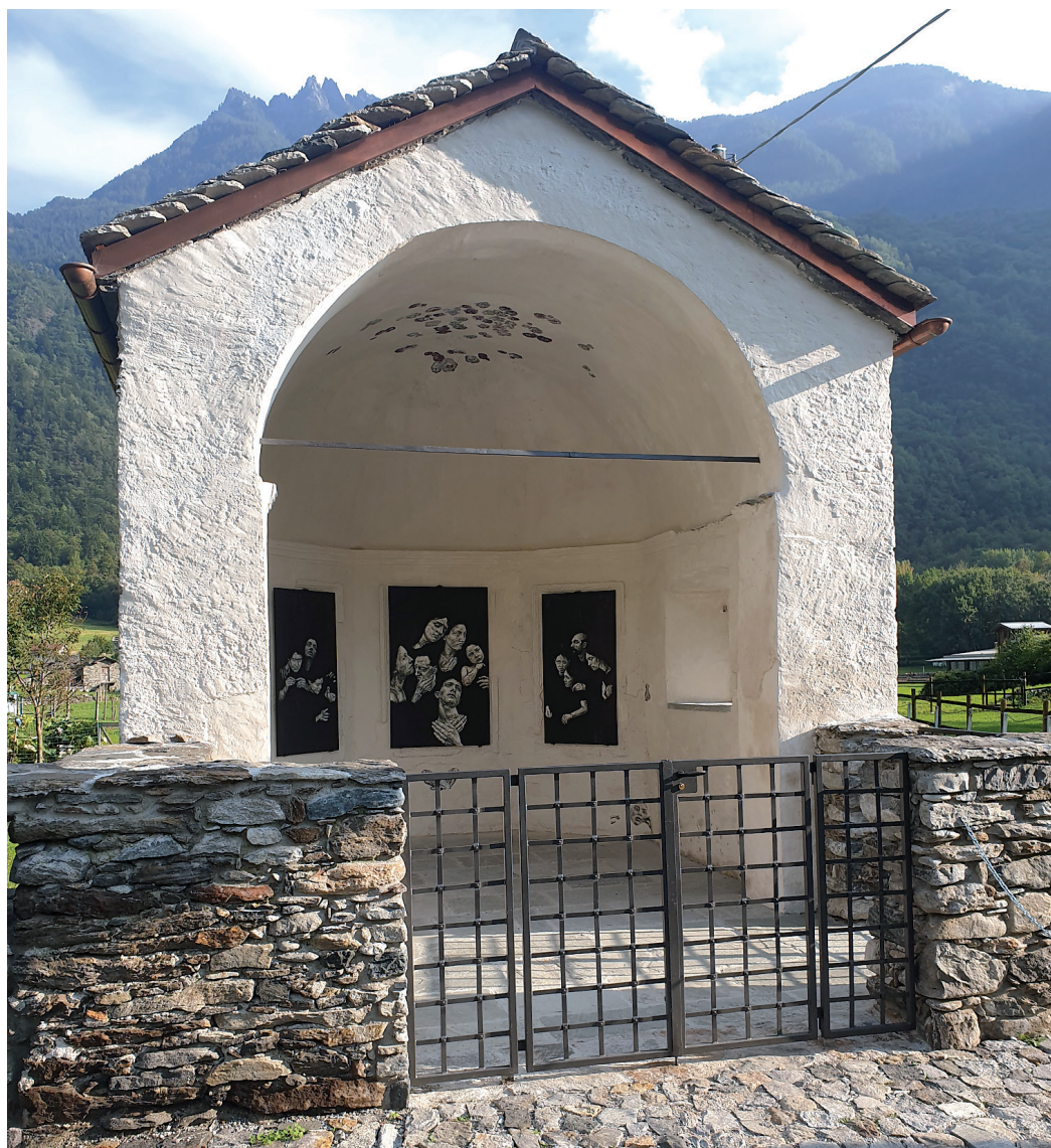
La cappella dopo il restauro del 2019.