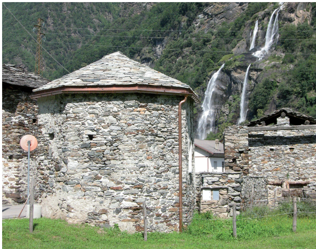
L'abside della cappella dopo il restauro del 2019.