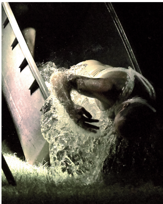
Nel Laboratorio che fu di Faust, si lavora ad un esperimento straordinario: la creazione chimica di un uomo, o meglio di un cervello artificiale.

È comunque nel 1587 che fu edito un volume ( Historia von D. Iohan Fausten ) in cui si narrava la sua vita, e che servì da ispirazione ai successivi autori per le loro “riscritture” delle vicissitudini faustiane, anche in chiave cinematografica e musicale.