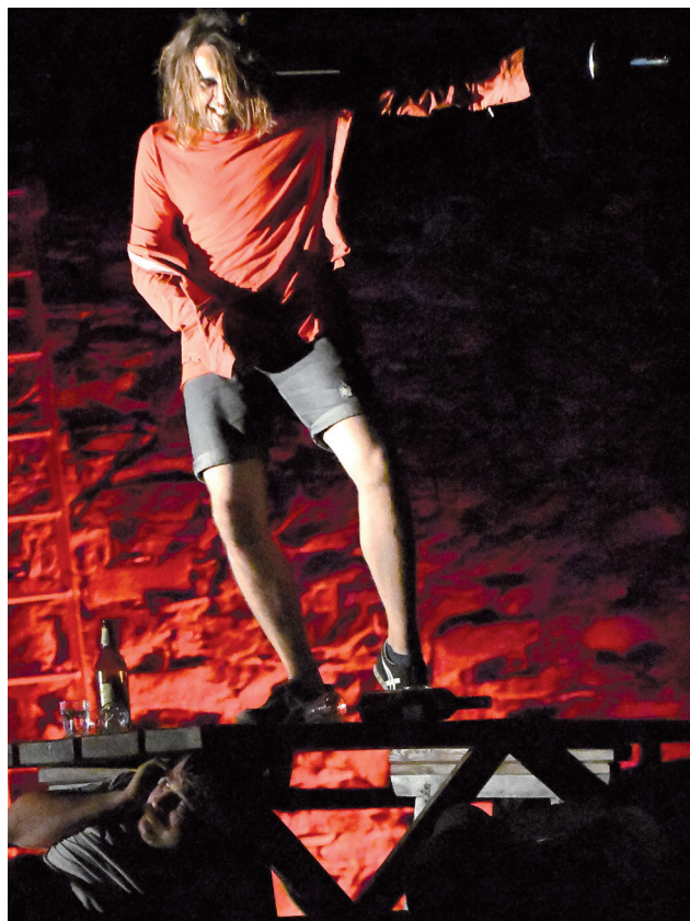
Nella taverna di Auerbech, alcuni personaggi brindano e cantano inneggiando al vino.

Per Goethe, il Faust – medico e teologo - diventa motivo dell’opera di una vita: dalla prima incompiuta tragedia “Urfaust” (1770-75) all’ultima definitiva versione del luglio 1831; nel proprio diario così scrisse: “ Portato a compimento l’impegno dominante. Ultima revisione. Scritto in bella e rilegato ”.