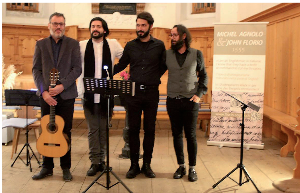
Evento artistico-teatrale nella chiesa di S.Lorenzo a Soglio.

rante per l'area del Belfort. Più avanti nel bollettino troveremo una recensione dello spettacolo.