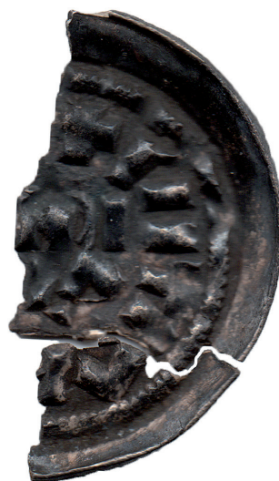
Figura 3. Rovescio del denaro coniato a nome dei re Ugo e Lotario dalla zecca di Milano tra il 931 ed il 947.

L'ampliamento dello scavo fatto quest'anno, ha portato al ritrovamento di alcune nuove strutture murarie, alcune delle quali, probabilmente, riconducibili ad un edificio di epoca bassomedievale; dagli strati associati a questi muri provengono le tre monete trovate nel 2019.