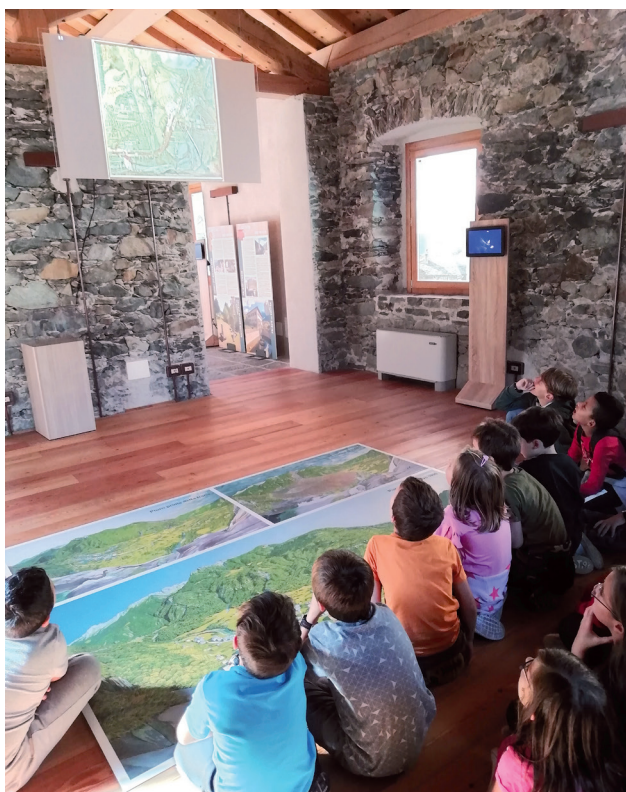
Visita a Infopiuro.