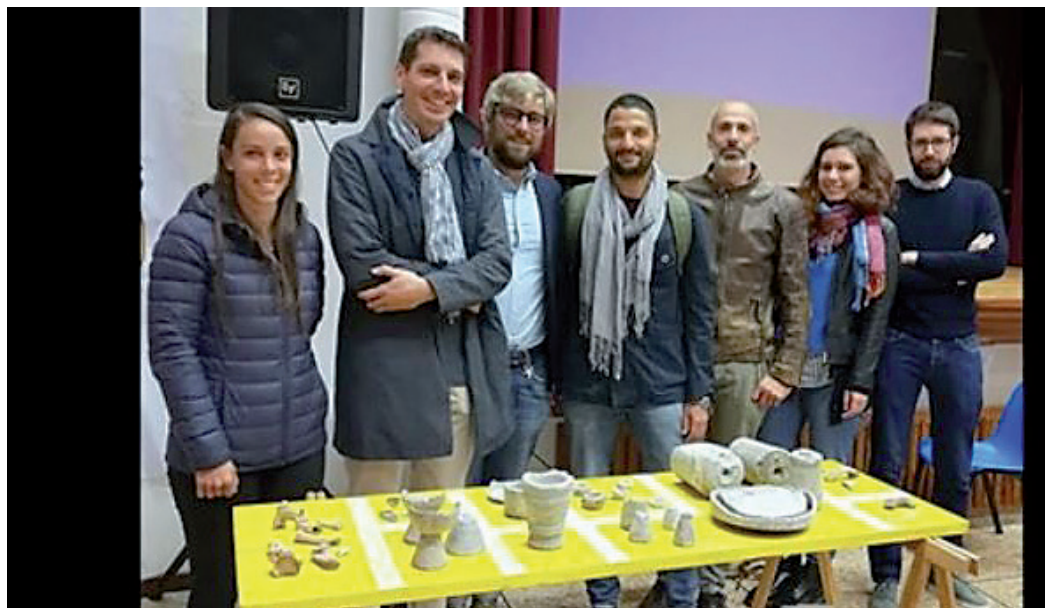
Archeologi e Docenti del dipartimento dell'Università di Verona presentano le prime risultanze emerse dalla ricerca 2019.

Il 10 ottobre, alla chiusura delle quattro settimane di scavo, l'Associazione ha organizzato una pubblica assemblea al teatro di Borgonuovo per illustrare alla popolazione ed agli appassionati le prime risultanze emerse dalle ricerche. Un folto ed interessato pubblico ha seguito la serata che ha avuto come relatori i docenti dell'Università e gli studenti che hanno preso parte alla campagna scavi.