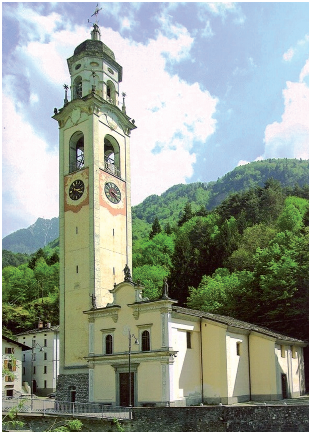
La chiesa dell'Assunta a Prosto di Piuro.