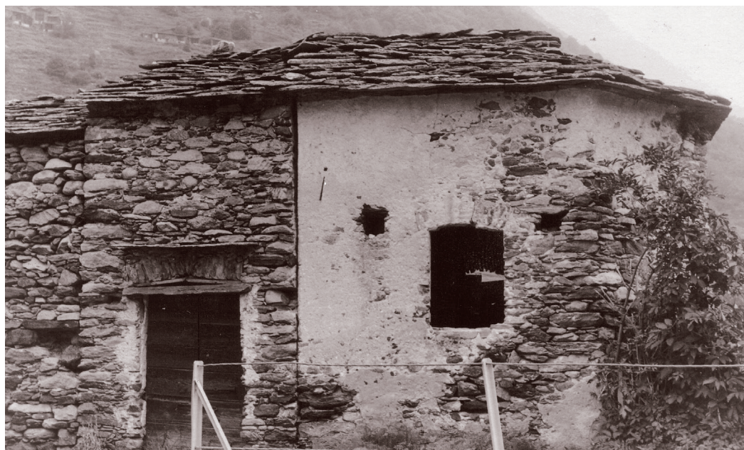
La cappella mancata nel 1974, quand'era unita a una cascina.