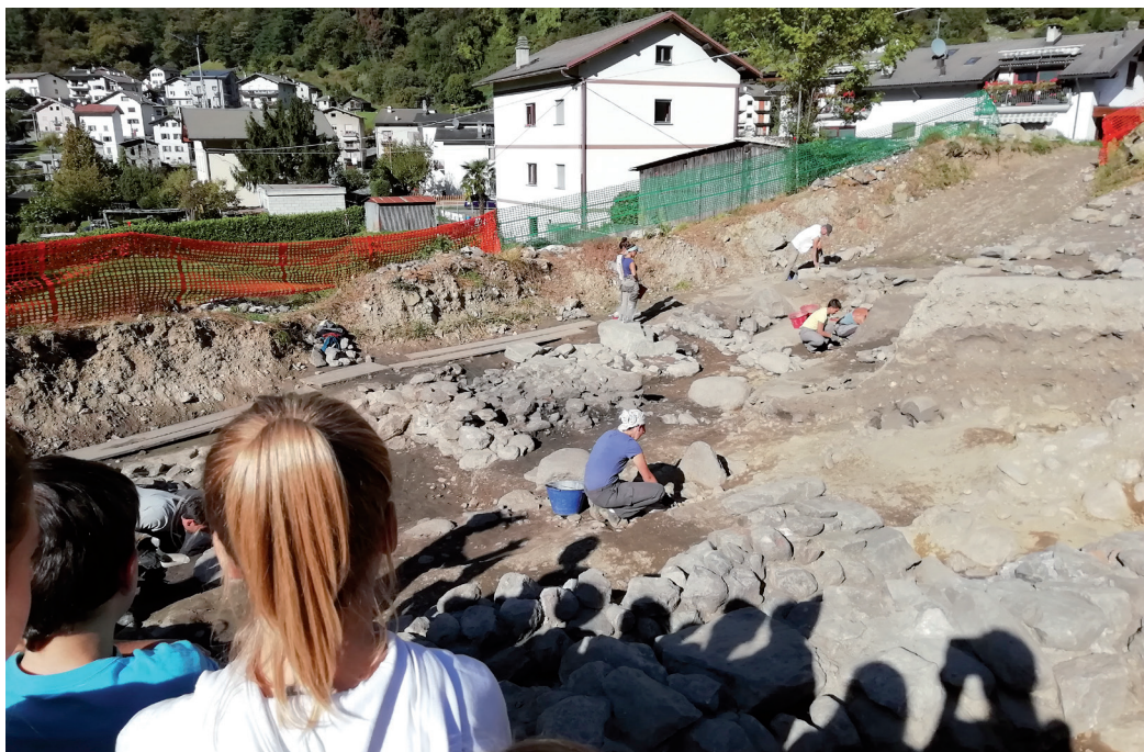
Archeologi al lavoro.

alla storia, al patrimonio e ai beni comuni del proprio territorio. Nel mese di ottobre i bambini della Scuola Primaria di Prosto hanno visitato lo scavo archeologico a “Mot de Castel” eseguito dagli archeologi dell’Università di Verona, dove hanno potuto osservare ciò che è stato riportato alla luce circa il passato dell’antica Piuro, sepolta dalla frana del 1618. Gli alunni hanno interagito direttamente con la responsabile degli scavi e con i ragazzi presenti, ponendo numerose domande che hanno permesso di approfondire meglio un pezzo di storia che li tocca da vicino.