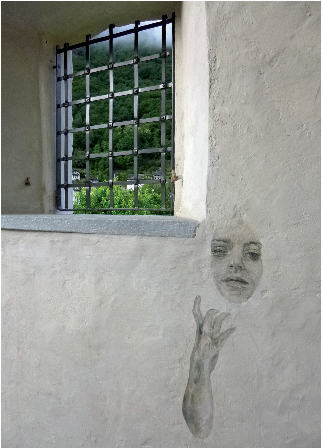
Mani, lineamenti e volti espressivi evocano la memoria dei defunti nella tragedia del 1618.