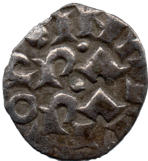
Figura 2. Rovescio di uno dei due denari mezzani conati a Pavia, come è possibile leggere al centro del campo: "PAPIA".