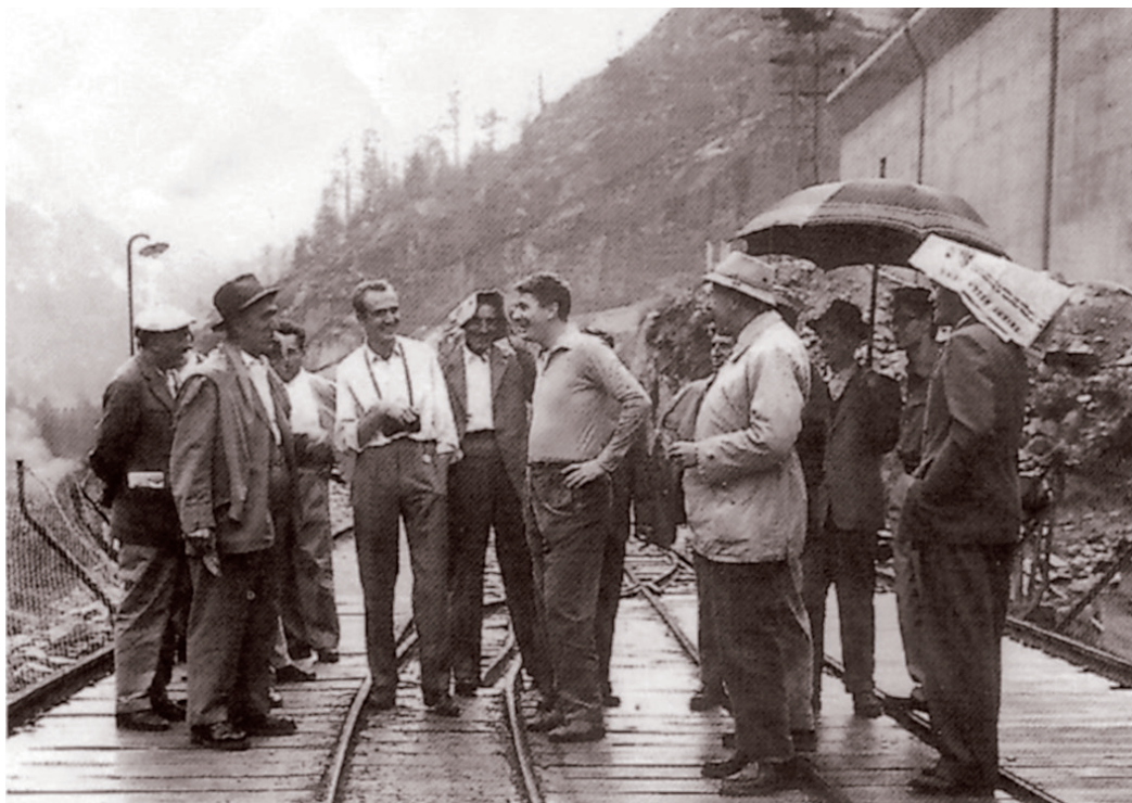
Il regista Ermanno Olmi in Val di Lei.

superato il senso di colpa che qualche insegnante di lettere tenta (tentava, una volta) di far nascere in chi, qua o là, ha poco rispetto per i precetti della sintassi tradizionale. Nel terzo millennio, per altro, il purismo linguistico ha perso tutto il suo mordente. Agli autori interessa non la forma, ma la sostanza del documento, la concretezza e la chiarezza dell'informazione. E queste non mancano mai, neppure quando l'emozione e l'urgenza dell'enunciato sono affidate ai registri informali del parlato, alla schematicità o alla freddezza dei molti dati tecnici. Quello che si sarebbe desiderato era un più esteso spiegamento del filo logico e cronologico che legò un documento a quello successivo, un contesto entro cui si svolsero i fatti, una individuazione delle cause e delle conseguenze prodotte. Troppo rare, almeno secondo noi, le brevi osservazioni appena accennate in mezzo a tanti documenti, quasi con noncuranza, con interrogativi lasciati senza risposta; soprattutto perché quelle domande erano quelle di molta gente semplice che la Valle la frequentava sui pascoli, negli abituri, sui ponteggi, sui camion e sulle teleferiche.