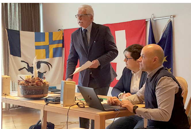
Prende il via a Soglio il progetto Interreg AMALPI 18.

Il 13 marzo prende ufficialmente il via a Soglio, nella vicina Bregaglia svizzera, il Progetto Interreg "Amalpi 2018" cui l'Associazione italo svizzera prende parte assieme al Comune di Piuro e ad altri dieci partner italiani e svizzeri. Il progetto promuove una innovativa strategia di fruizione della Bregaglia, della Valchiavenna, del Moesano e