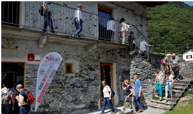
Visite guidate ai Musei e area archeologica di Belfort.

Il 22 agosto a palazzo Vertemate Franchi Slow Food della Mera, in collaborazione con l'Albergo Piuro e la nostra Associazione ha presentato una cena a base di prodotti dell'agricoltura e della tradizione locale.