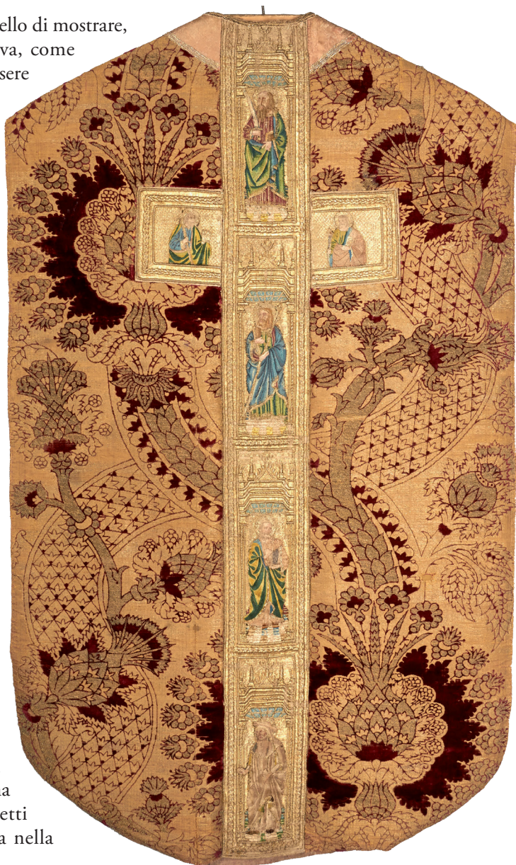
Figura 1: pianeta di Piuro, sepolta dalla disastrosa frana di Piuro del 1618 e recuperata nel 1620. La frana, con le leggende ad essa correlate, è uno dei temi più suggestivi di «Storie di Bregaglia».

Le azioni progettuali si articolano in due fasi. Nella prima (novembre-dicembre 2019) i gruppi classe hanno effettuato una visita guidata 6 al fonte battesimale in pietra ollare di San Lorenzo e al Museo del Tesoro di Chiavenna, dove sono conservati molti oggetti artistici di pregio provenienti dalla val Bregaglia. Durante la visita, agli studenti è stata proposta una lettura 'speciale' degli oggetti d'arte, esaminati dapprima nella loro cornice storica e poi attraverso la loro associazione, diretta o indiretta,