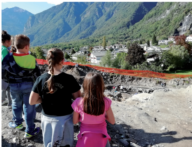
Area Scavi Mot del Castel.

È fondamentale che la scuola mantenga contatti diretti con le organizzazioni locali in modo da avvicinare le giovani generazioni