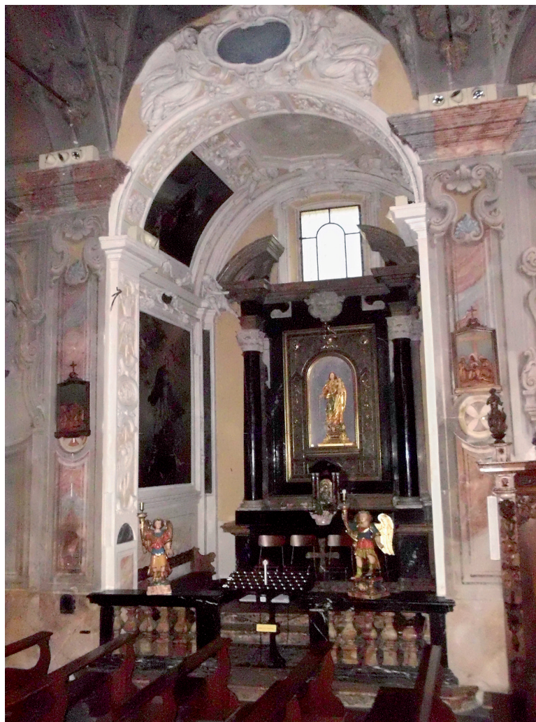
La cappella dei cinturati di Sant'Agostino nella chiesa di Prosto.