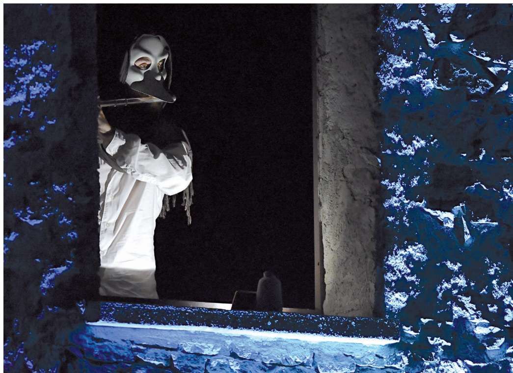
“Prologo in cielo” Mefistofele chiede al Signore licenza di “guidare Faust nella sua ricerca della conoscenza, al fine di portarlo alla perdizione eterna”.

campane che annunciano la Pasqua; sedurrà, portandola ad un tragico destino, la giovane Margherita.