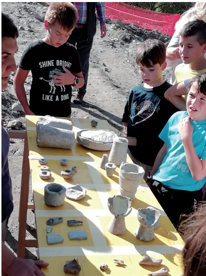
Reperti rinvenuti al mot del Castel.

“A me l’archeologia sembra divertente, magari un giorno scaverò anch’io!”