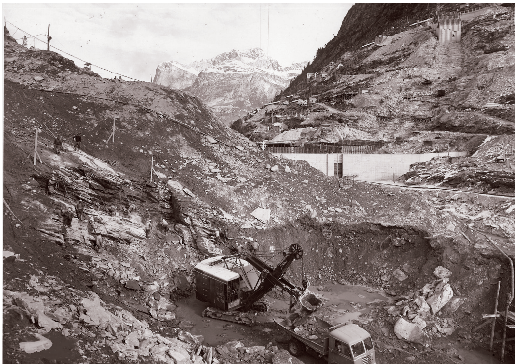
Fasi di lavoro della diga.