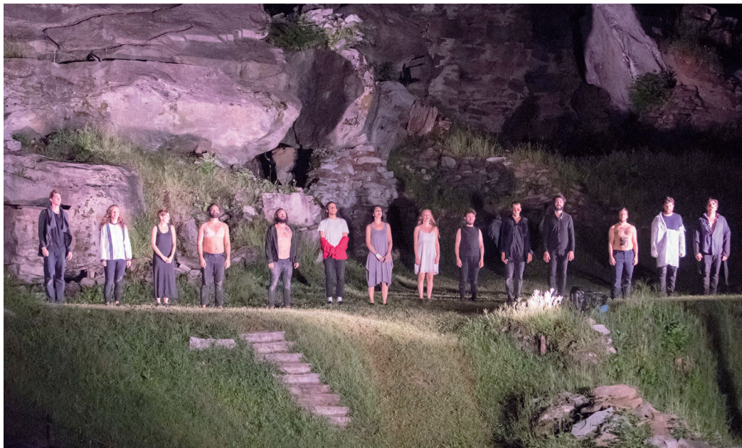
Gruppo Attori di “Belfort Theatre Campus” 2019.

Risuona la Voce di Sempre: Adamo dove sei? Dove sei Faust? E ancor oggi, che affidi il tuo destino a freddi algoritmi con cui “nutri” l’intelligenza artificiale, Uomo del mio tempo, sei ancora quello della pietra e della fionda... ” (S. Quasimodo), da sempre alla ricerca di te stesso e di quella promessa di Infinito che è in te.