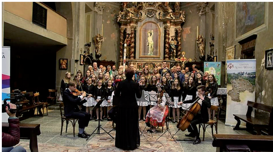
La "Schola Cantorum" proveniente dalla città polacca di Nowy Wisnicz progettata dall'architetto piurasco Trapolini Mattia, ha tenuto apprezzati concerti nelle chiese di Villa di Chiavenna e Prosto di Piuro.

tetti costruttori emigrati dalla nostra valle. La storica città di Nowy Wisnicz fu infatti progettata circa quattrocento anni fa nei suoi edifici più rappresentativi dall'architetto piurasco Mattia Trapolini. Nelle giornate del soggiorno in Val Bregaglia la "Schola cantorum" ha tenuto due apprezzati concerti nelle chiese di Villa di Chiavenna e di Prosto.