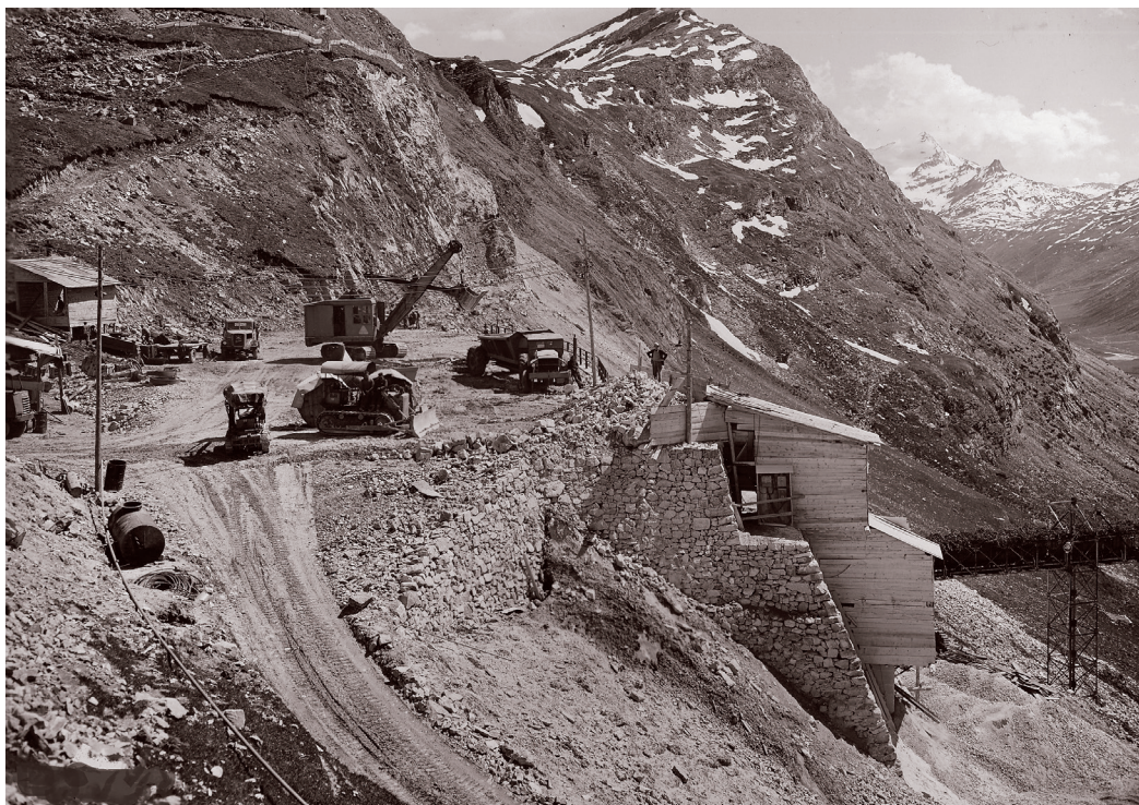
Fasi di lavoro della diga.

di campo che ti prende. Inutile cercare testi brevi e ben studiati, di autori che ambiscono ad essere poeti. Né ci sono lunghi testi che decantano la retorica della bellezza poetica di un pascolo, di una cima o di un fiore, il coraggio di uno scalatore, la vita idilliaca di un pastore. Il montanaro sa che immagini di quel genere esistono solo per pochi momenti di pochissime giornate lungo l'intera annata, durante la quale, invece, sono quotidiani la fatica, le preoccupazioni per le persone e per gli animali, la precarietà dell'isolamento geografico e umano.