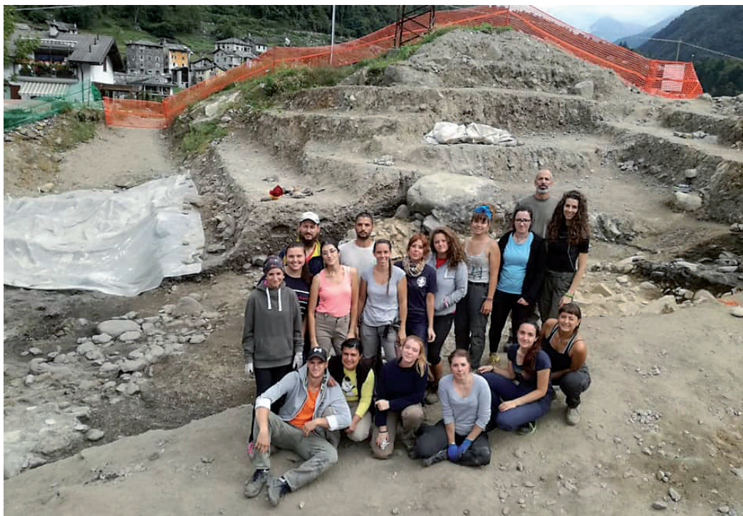
Un turno di archeologi che ha portato alla luce oggetti in pietra ollare, monete e rinvenute sepolture.