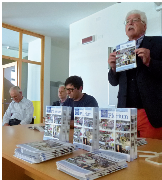
Presentazione annuale del bollettino Plurium alla scuola primaria di Piuro.