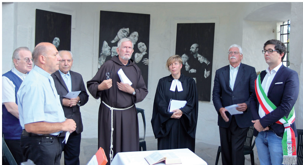
L'inaugurazione della cappella il 4 settembre 2019 con una preghiera ecumenica.

emigrati che avevano protestato contro la decisione del Capitolo, desistendo poi. Di quella che doveva essere una chiesetta rimase così solo l'absidiola, chiusa da un muro a cui fu poi addossata una stalla-deposito.