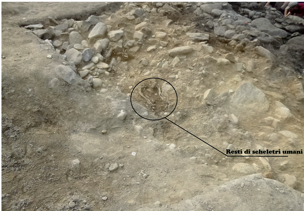
Resti di scheletri umani