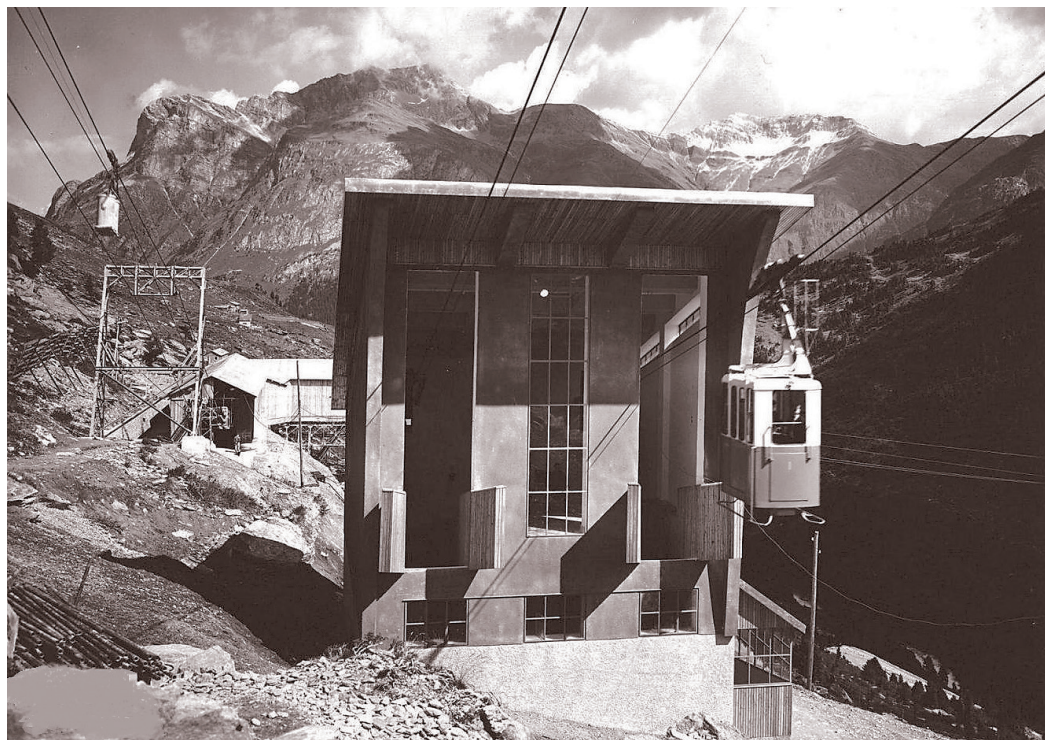
Stazione di arrivo funivia in Val di Lei.

a sostegno e a completamento delle attività economiche con le quali la Piuro medievale e rinascimentale costruiva la sua ricchezza di prima della frana e della ripresa del dopo. Parte essenziale di quella vita fu la componente religiosa, per la quale nessun prete di Piuro o di Villa venne meno al dovere pastorale di restare in contatto coi propri parrocchiani anche d'estate, di salire da Savogno per Piangesca e il passo di Lei. Nei secoli la pratica liturgica si appoggiò a due miseri edifici: una chiesa, più antica, che altro non era che una cascina adattata per la celebrazione della messa patronale, Sant'Anna; ma il vento spesso "estingueva le candele e bisognava coprire l'ostia e le particole consacrate con la patena a fine il vento non le rapisse con scandalo delli astanti". "In tempo di escrescenze del Reno" i pastori dovevano o perdere la santa Messa o mettersi a pericolo della vita "in sguazzandolo" (attraversarlo). Allora si decise di realizzare un nuovo edificio, più decoroso. Era il giugno 1744.