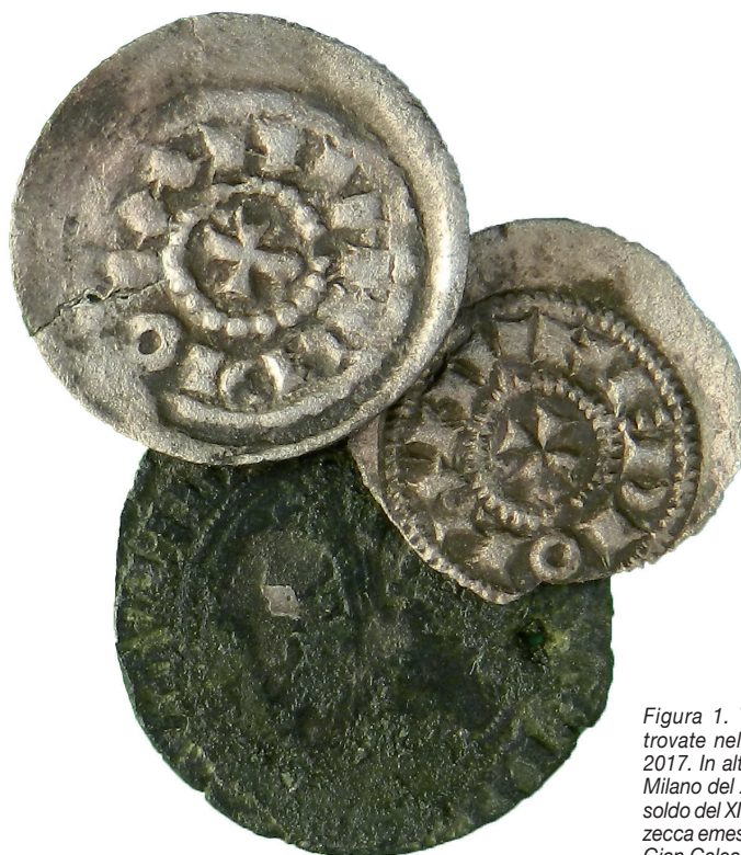
Figura 1. Tre delle quattro monete trovate nella campagna di scavo del 2017. In alto i due denari scodellati di Milano del XII-XIII secolo ed in basso il soldo del XIV-XV secolo della medesima zecca emesso sotto il dominio del duca Gian Galeazzo Visconti.

Nell’arco delle tre campagne di scavo succedutesi presso la collinetta detta “Mot al Castel” a partire dal 2017, tra i vari reperti rinvenuti, ci sono state anche 7 monete delle quali 4 trovate nel 2017 (fig. 1) e 3 nel 2019. Queste coprono un arco temporale di coniazione compreso tra il X ed il XV secolo.