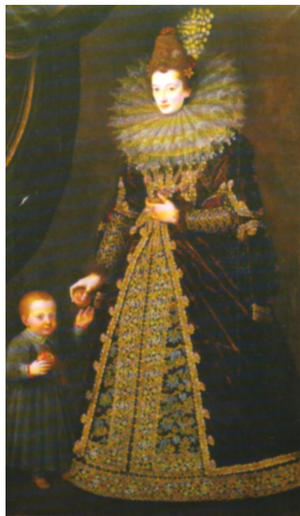
Fig. 2: Pittore lombardo inizi XVII secolo, Ritratto di Isabella Brivio in compagnia di un figlio , olio su tela, già Milano, collezione Brivio Sforza

Belle carni della Signora Isabella Brivia non Pallade, Giunon, Venere bella al Signoril pastor mostraro avanti sì vive carni, ignuda e questa e quella per aver di beltà gli ultimi vanti, che ciascuna di lor paruta ancella non fosse, al par de casti lumi e santi ch’ornan le vostre carni; e solo il volto havrebbe a quelle ignude il premio tolto. 16