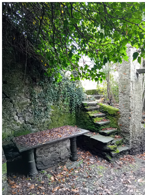
Fig 5. La corte antistante il crotto con il tavolo a rocchi di pietra ollare.