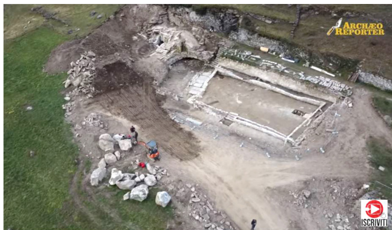
Il paese sepolto nelle Alpi, scoperte archeologiche 2023 a Piuro: palazzi dalla frana di 400 anni fa

Ecco alcuni dei momenti più significativi.