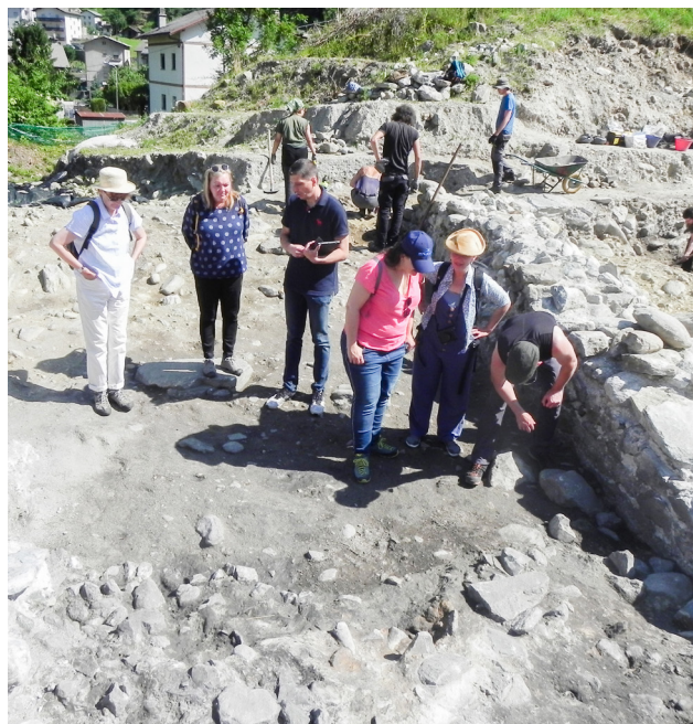
Fig. 4 e 5. Visita scavi Prof. Università di Zurigo.