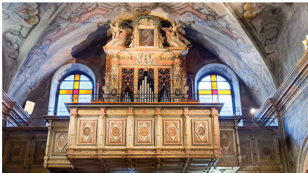
Fig. 1. L'organo di Prosto.

Tra le chiese barocche della Valchiavenna quella di Santa Maria Assunta a Prosto di Piuro è una delle più interessanti, decorata com'è da pregevoli tele francesi, affreschi, stucchi e intagli seicenteschi. Assieme a queste opere custodisce uno degli organi più antichi della valle, pur con vari successivi rimaneggiamenti e adattamenti. Lo strumento fu eseguito nel 1684 per 1247 lire da Carlo Prata, nato a Gera Lario nel 1617 e attivo in Lombardia e nel Trentino, dove morì nell'anno 1700 1 (fig. 1).