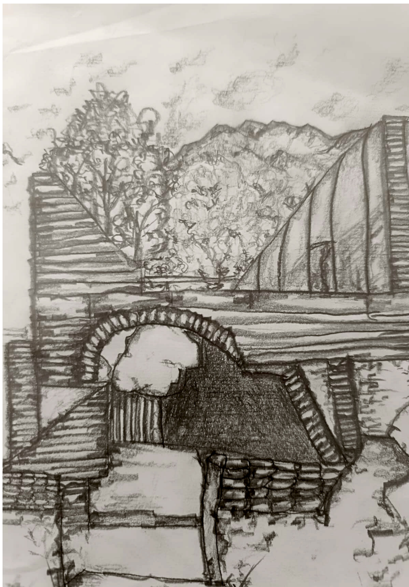
Fig. 2. Il Belfort visto dagli alunni della Classe V, 2024