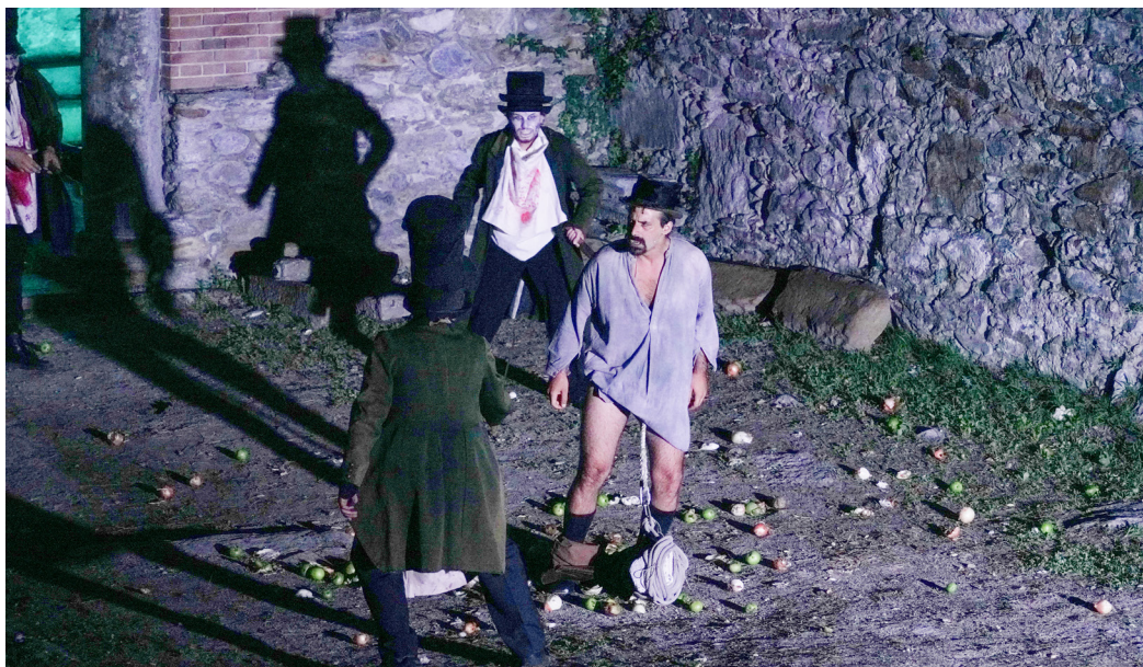
Fig. 5. Peer vive con un popolo così diverso dagli "umani", giungono a tentare di cucirgli una coda sulla schiena.

È comunque un fuorilegge e non può che lasciare il proprio paese: costruisce una capanna lontano, sulle colline.