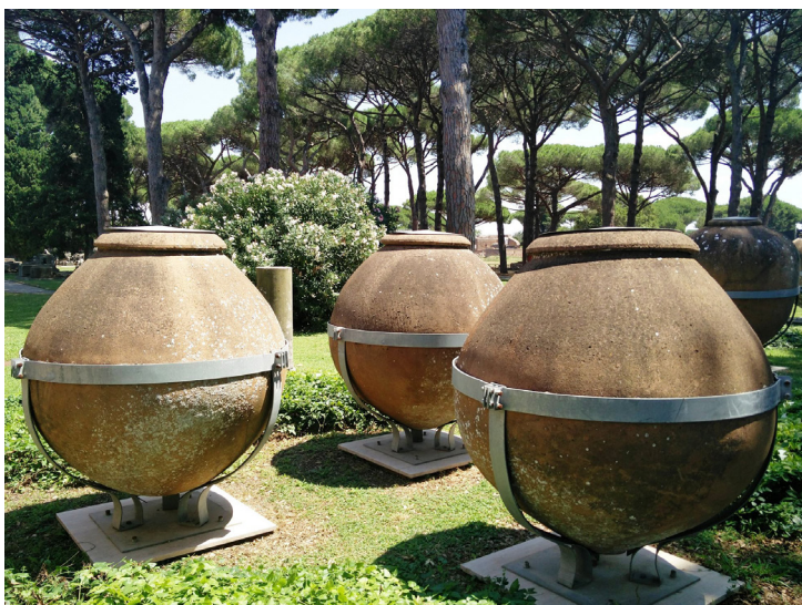
Fig 3. Dolia nel Parco archeologico di Ostia antica.