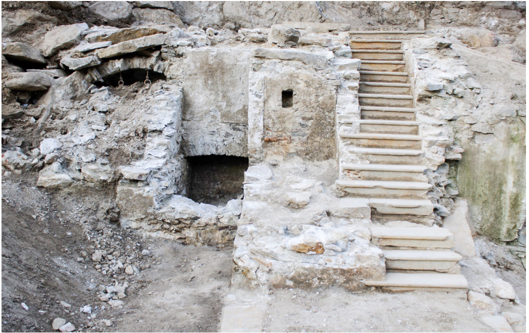
Fig 4. Piuro (SO), Cantina del Piöcc, Area 2000, Settore Gamma, porzione ovest in cui sono visibili da destra a sinistra: la scala di collegamento al secondo piano, il probabile vano sottoscala, il gabinetto e una stanzetta voltata.