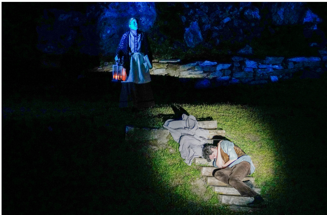
Fig. 4. Peer vive in un’esperienza onirica la seduzione della figlia del re dei troll.

“Sui monti di Ronde”, “saltando e magnificando la sua origine e il suo futuro, “balza in avanti, ma picchia il naso contro una roccia, cade e resta lì disteso” privo di sensi; in un’esperienza quasi onirica - seduce la “la donna vestita di verde” , figlia del Vecchio di Drove, re dei troll 5 , il quale gli offre la possibilità di un matrimonio “riparatore”, divenire così suo genero e vivere “sulla montagna” come e con quel popolo così diverso dagli “umani”.