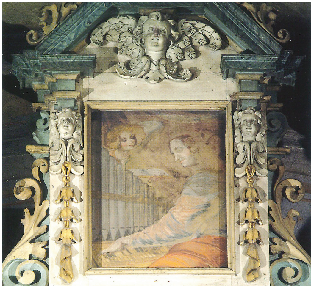
Fig. 2. Particolare della cimasa dell'organo.

francese Nicolas Poussin. Solo nel 1902, dopo un modesto allungamento della chiesa verso il fiume Mera, l'organo fu addossato alla controfacciata, dov'è oggi. Vi sale all'angolo orientale una bella scala a chiocciola in ferro battuto.