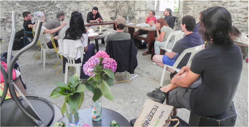
Fig. 7 e 8. Campus & Teatro.