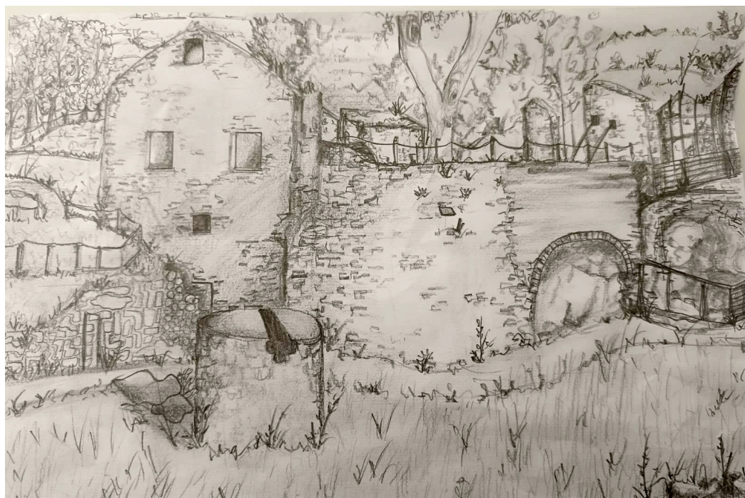
Fig. 1. Il Belfort visto dagli alunni della Classe V, 2024