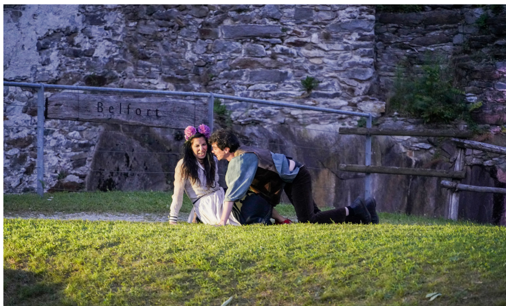
Fig. 3. Peer incontra Solvejg, che le resterà fedele a lungo al reciproco sentimento d'amore.

Alla stessa festa incontra Solvejg, una giovane che lo aspetterà a lungo, fedele al reciproco sentimento d'amore maturato tra loro.