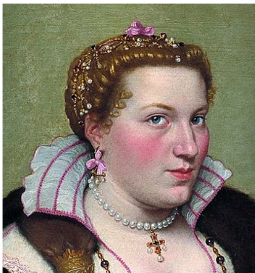
Fig. 4: G. B. Moroni, Ritratto di Isotta Brembati Grumelli , 1550 circa, olio su tela, Bergamo, Fondazione Palazzo Moroni, particolare.

non ha tralasciato, volutamente, un singolare dettaglio: gli orecchini indossati da Caterina, formati da tre perle pendenti di grandezza diverse, abbelliti da un fiocco di raso, sono gli stessi sfoggiati dalla madre Isotta, anni prima, nel celebre ritratto del Moroni, conservato insieme a quello del marito nell'omonimo palazzo bergamasco ( fig. 4 ) 30 . Se consideriamo che Isotta era già morta prima del matrimonio della figlia, tale particolare assume quindi il carattere di un affettuoso omaggio da parte di Caterina alla memoria dell'illustre madre.