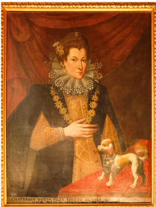
Fig. 3: Pittore lombardo inizi XVII secolo, Ritratto di Caterina Isotta Grumelli , olio su tela, Piuro, Palazzo Vertemate Franchi.

Sappiamo, inoltre, che la coppia era solita trascorrere dei periodi di villeggiatura in alto Lario: in particolare risultano frequenti i soggiorni di Nicolò presso Gravedona, dove risultava abitare, tra Cinque e Seicento, una Felicità Vertemate, moglie di Stefano Stampa 25 . Caterina Isotta, invece, appare più assiduamente a Domaso, forse dove la famiglia Grumelli possedeva delle proprietà, poiché la presenza nel borgo di vicolo dei Grumelli spingerebbe verso tale ipotesi: a Domaso ella era sovente ospite dei fratelli Casnedi, mentre a Gravedona tenne a battesimo, nel 1608, la piccola Lucrezia Margherita Giunoni 26 .