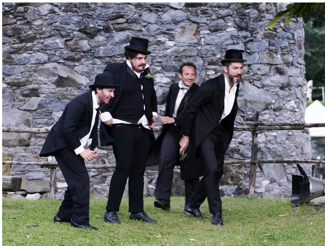
Fig. 1. Compagni scapestrati di Peer, dalla fantasiosa esuberanza, che come lui, liberi da ogni convenzione e rimorsi.

L'opera 4 , composta in versi nel 1867, durante un periodo di residenza dell'autore in Italia - tra Roma, Casamicciola dell'Isola d'Ischia e Sorrento - è la narrazione "epica" della vita di Peer Gynt (e del suo "sogno" di "conoscere se stesso"); essa si sviluppa lungo cinque atti : I primi tre vedono "l'antieroe", giovane "scapestrato" dalla fantasiosa esuberanza di vita e di pensiero, immaginifico sognatore (con non molti scrupoli), muoversi nella sua terra, tra montagne e ambienti agresti, apparentemente libero da ogni convenzione e rimorsi ma - intimamente - alla ricerca del proprio "essere" e di un "riscatto" dalla condizione di povertà a cui, insieme alla madre, lo ha condotto la vita dissennata del padre.