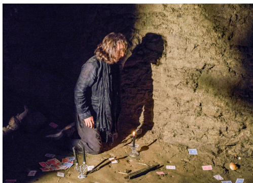
Fig. 9/10/11/12. Scene drammatiche, tratte dallo spettacolo itinerante, in postazioni suggestive di Belfort, interpretate da giovani attori.

ottimo livello, frutto di passione e dedizione professionale e che la fondazione della “Compagnia” è stata giustamente “realizzata” per consentire a tutti i suoi componenti più larghe e impegnative esperienze.