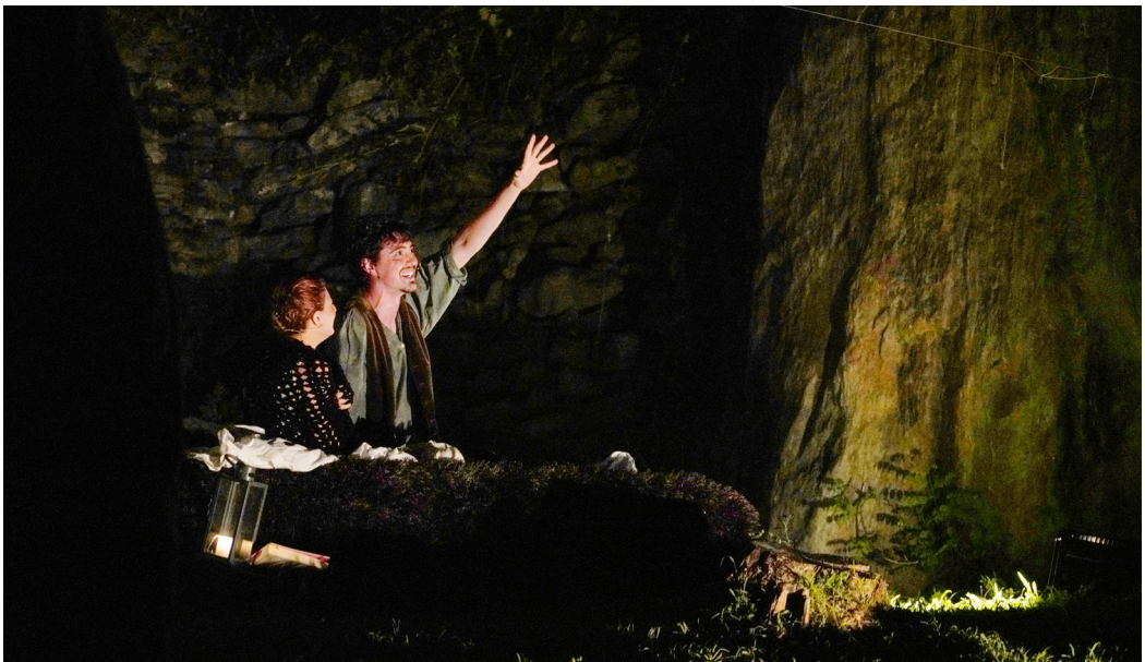
Fig. 8. Peer assiste la madre negli ultimi istanti di vita raccontandole favole.

Peer è felice e le dà il benvenuto, ma mentre entra nel suo rifugio, appare una donna anziana con un vestito verde, accompagnata da un ragazzo zoppicante al suo fianco: è la “ donna vestita di verde ” incontrata in passato e il “ marmocchio ” è il figlio avuto da Peer; la donna affronta il suo “ vecchio sposo ”, rivendicando i “ diritti ” del bambino, e lo maledice costringendolo a ricordarsi di lei e di tutti i suoi peccati precedenti.