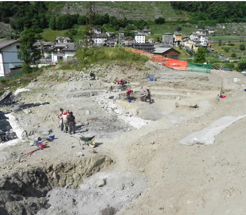
Fig. 2 e 3. Scavi Mòt del Castèl.

ranamente, negli spazi coperti del Belfòrt, si procedeva alla catalogazione ed incassamento di tutti i reperti precedentemente rinvenuti (fig. 2 e 3).