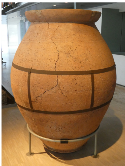
Fig 2. Dolio conservato nel Museo gallo-romano di Saint-Romain-en-Gal a Vienne in Francia.