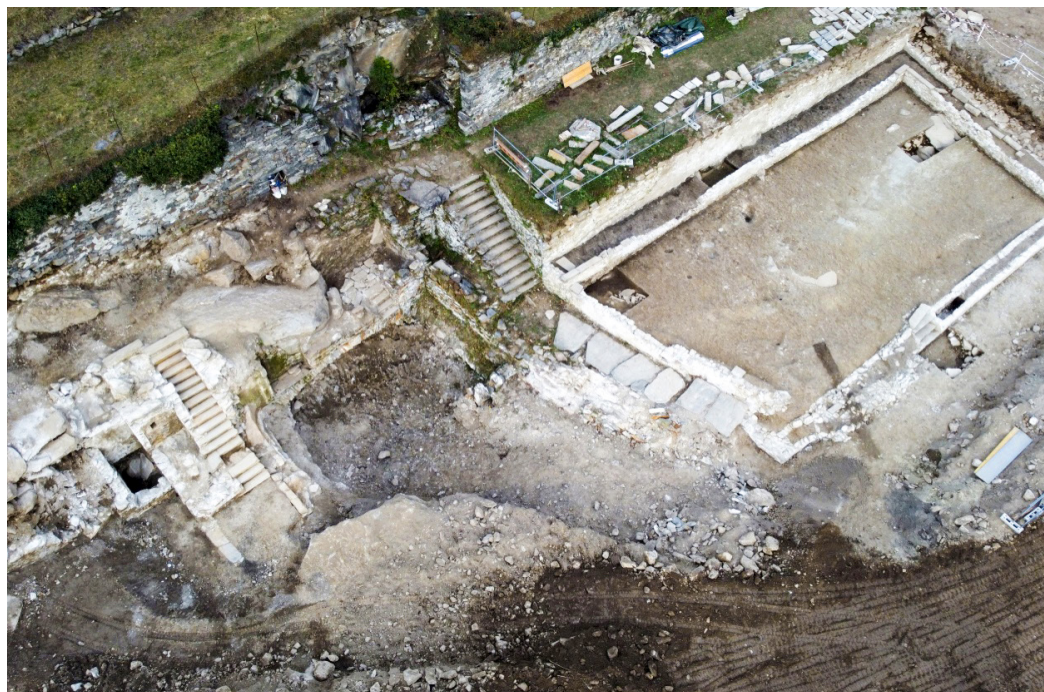
Fig 1. Piuro (SO), Cantina del Piöcc, Area 2000, Settore Gamma, vista generale.