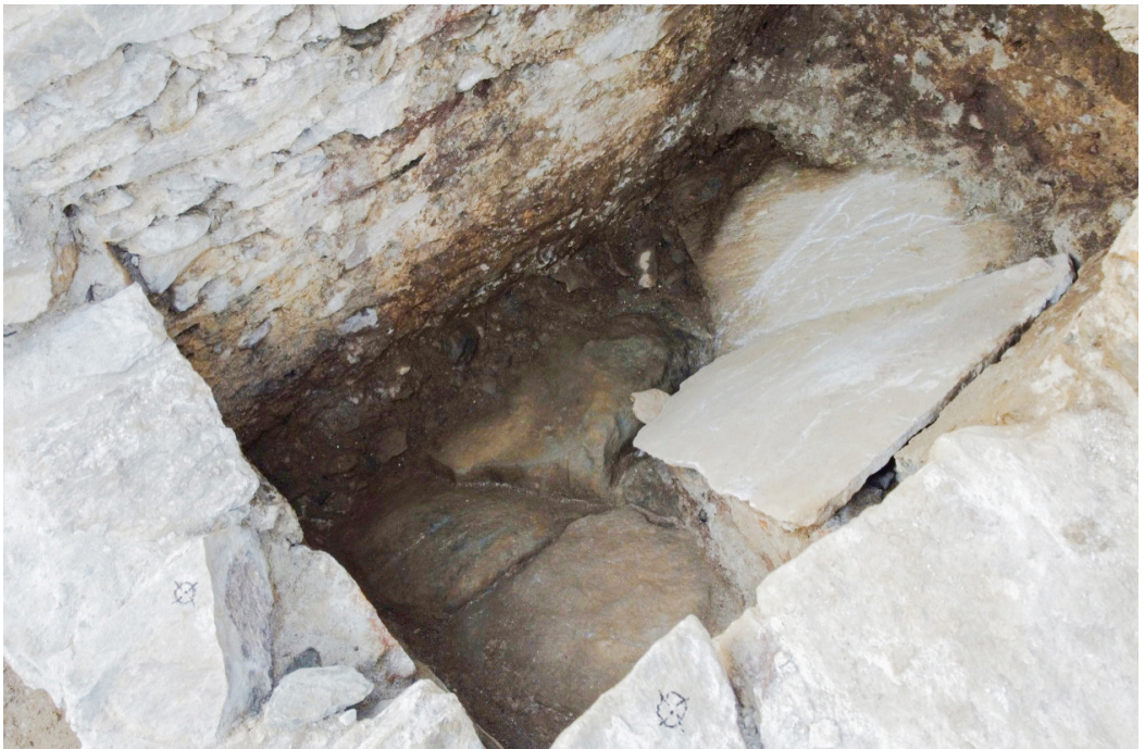
Fig 5. Piuro (SO), Cantina del Piöcc, Area 2000, Settore Gamma, porzione ovest, particolare del fondo della struttura di scarico del supposto gabinetto.