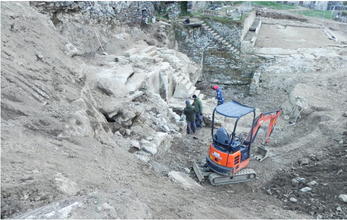
Fig. 16, 17 e 18. Scavi Archeologici del Palazzo Bavele.