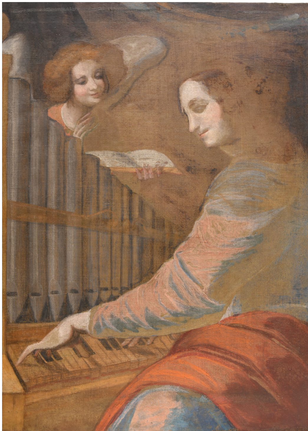
Fig. 3. Santa Cecilia all'organo, olio su tela dopo il restauro, 1684.