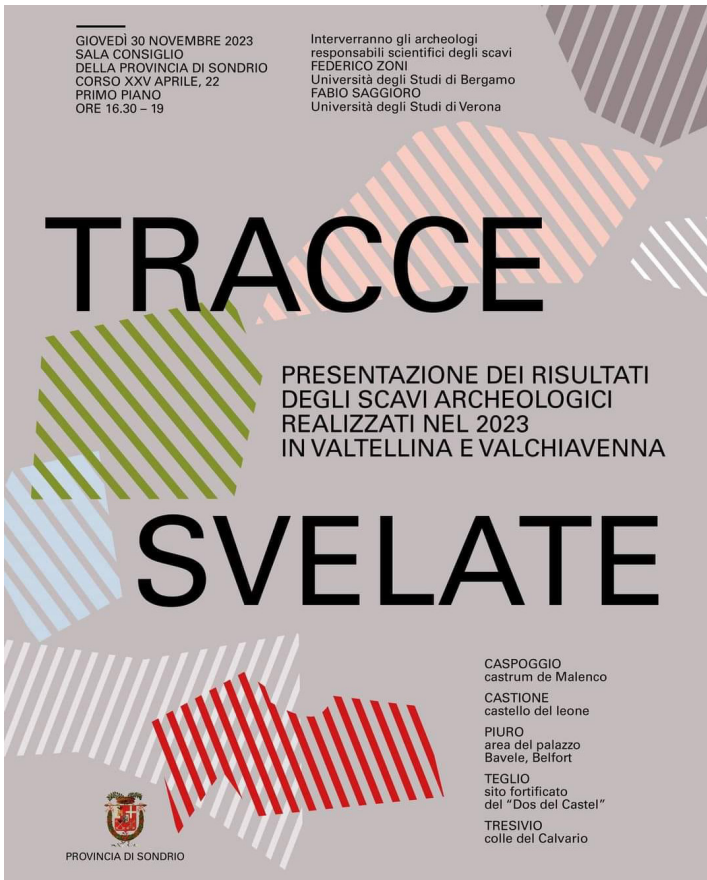
Fig. 20. Convegno su Archeologia a Sondrio.