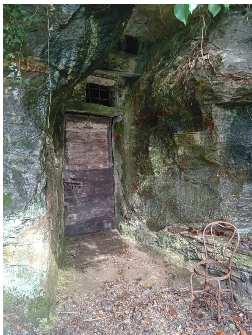
Fig 6. L'ingresso del crotto.