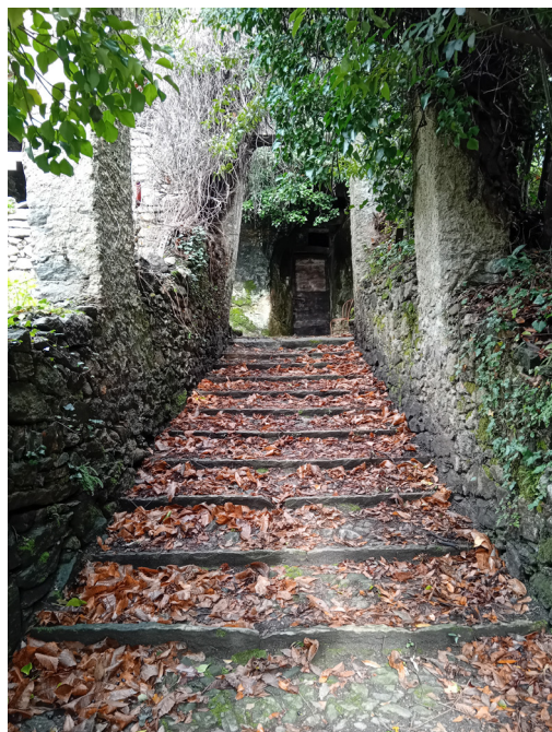
Fig 4. La scalinata che conduce al crotto Vertemate Franchi a Cortinaccio di Piuro.