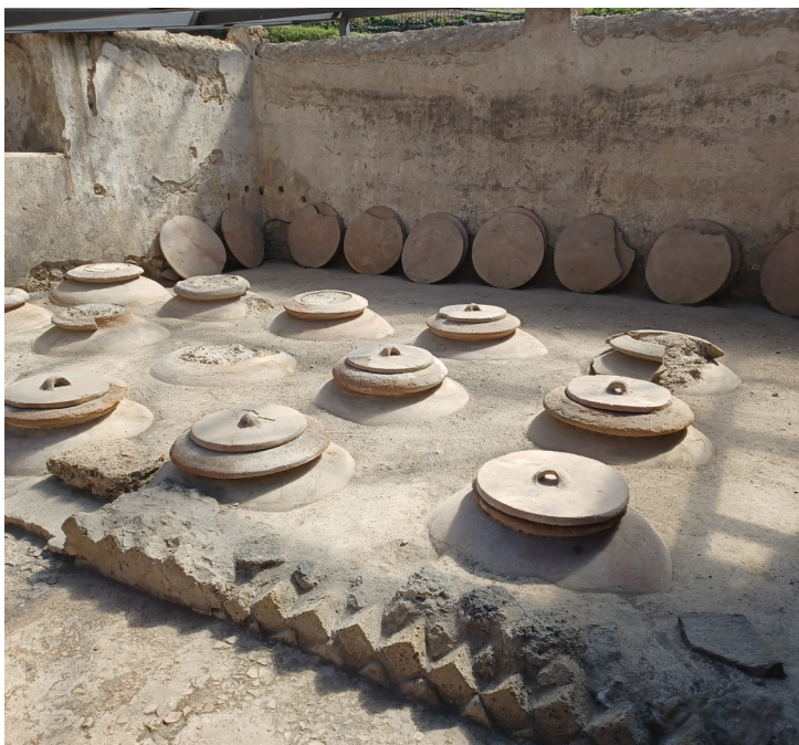
Fig 1. Dolia interrati nella Villa Regina a Boscoreale.

Tra coloro che morirono travolti dalla frana del 4 settembre 1618 a Piuro ci fu Giovan Battista Vertemate Franchi, figlio di Guglielmo e Ginevra Alberti di Bormio. Egli aveva dei debiti che, l'anno dopo la sua morte, furono saldati. In particolare a Battista Salis di Chiavenna fu riconosciuto il crotto del Vertemate Franchi a Cortinaccio, stimato 6500 lire, compresi l'ingresso e la sua corte, ma non il tavolo nella stessa che presenta ai quattro angoli dei rocchi di pietra ollare e fu concesso al creditore e console di Piuro Francesco Forno. Assieme ai relativi coperchi, ferri e utensili, al Salis furono dati pure 14 dei 15 dolia presenti nel crotto e contenenti del vino, che erano stati valutati 1600 lire da Battista Foico di Cortinaccio