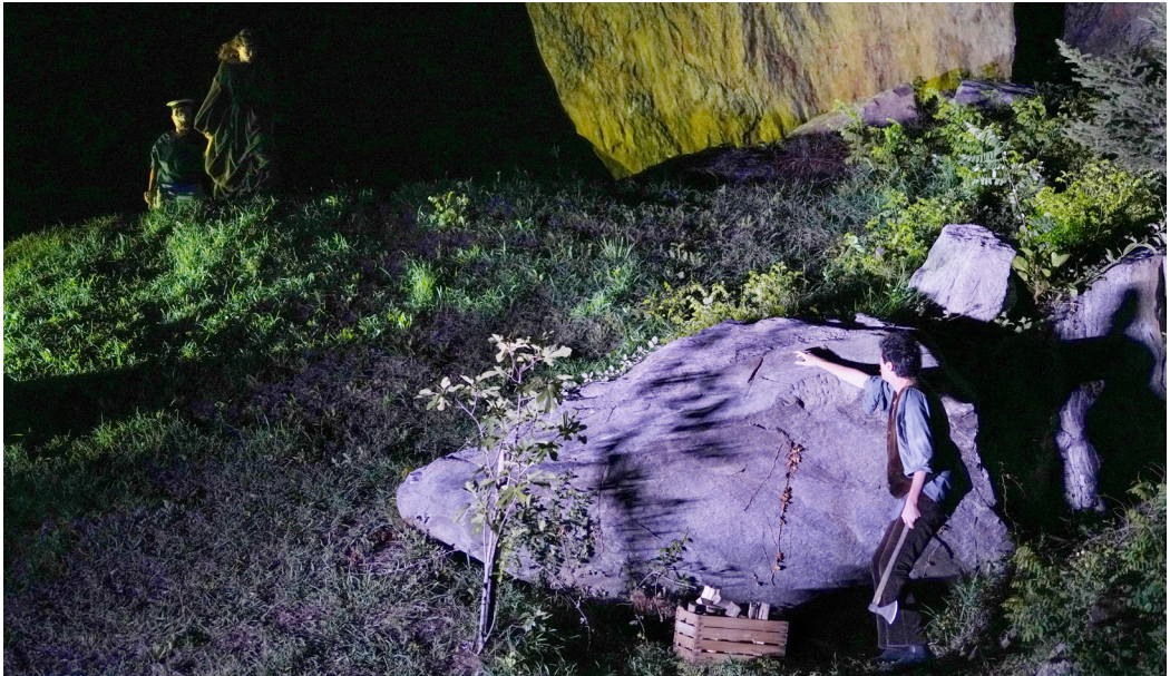
Fig. 7. Una donna anziana, accompagnata da un bambino zoppicante, rivendica la paternità di Peer.

Peer è felice e le dà il benvenuto, ma mentre entra nel suo rifugio, appare una donna anziana con un vestito verde, accompagnata da un ragazzo zoppicante al suo fianco: è la “ donna vestita di verde ” incontrata in passato e il “ marmocchio ” è il figlio avuto da Peer; la donna affronta il suo “ vecchio sposo ”, rivendicando i “ diritti ” del bambino, e lo maledice costringendolo a ricordarsi di lei e di tutti i suoi peccati precedenti.