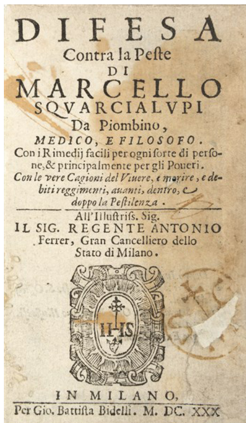
Fig. 1. Intestazione del Trattato contro la peste di M. Squarzialupi

Lasciata la Boemia nel 1577 Marcello Squarzialupi fece un breve rientro in Valtellina, l'anno dopo si trasferì in Polonia, a Breslavia, presso il medico imperiale Johannes Crato von