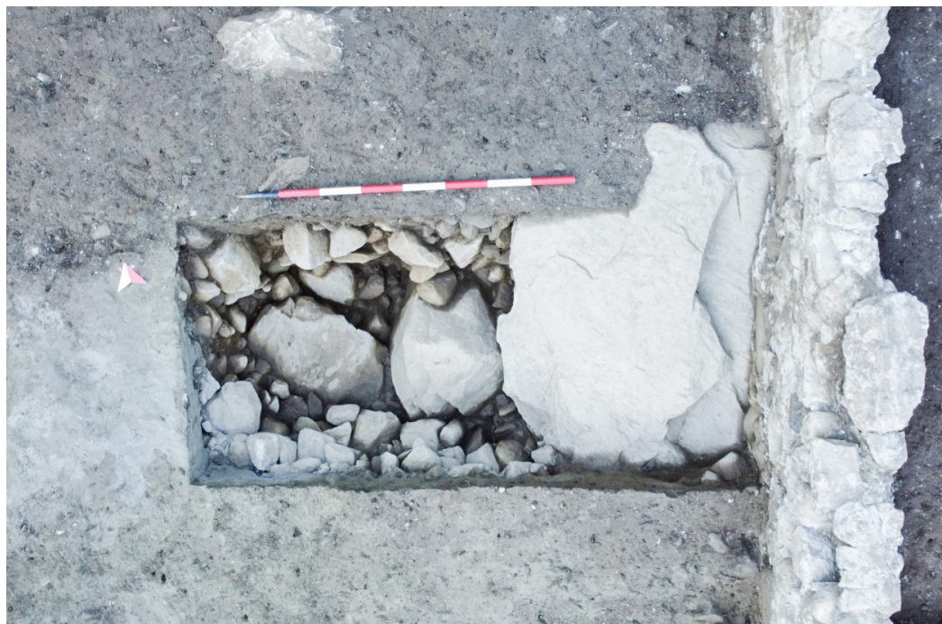
Fig 3. Piuro (SO), Cantina del Piöcc, Area 2000, Settore Gamma, giardino est, saggio 1.

significato una pianificazione con una modificazione del versante del monte non banale. Oltre alla costruzione dei perimetrali e delle aiuole, per la zona centrale del giardino è stato creato un sottofondo costituito da tre diversi livelli: in sequenza, dal basso verso l'alto, sono state prima riportate pietra di medie e piccole dimensioni, poi la sabbia ed, infine, del terriccio da coltivazione ( fig. 3 ). Lo scopo non era solamente quello di rendere pianeggiante la superficie coprendo i macigni di più grandi dimensioni, ma anche di avere un sottofondo drenate che evitasse il ristagno dell'acqua con detrimento sia delle piante coltivate sia delle strutture adiacenti. Inoltre, la pulizia del piano di calpestio del giardino e della superficie delle aiuole ha permesso il rinvenimento di diversi reperti, quali frammenti ceramici e di pietra ollare, elementi metallici e una ventina di monete cronologicamente coerenti.