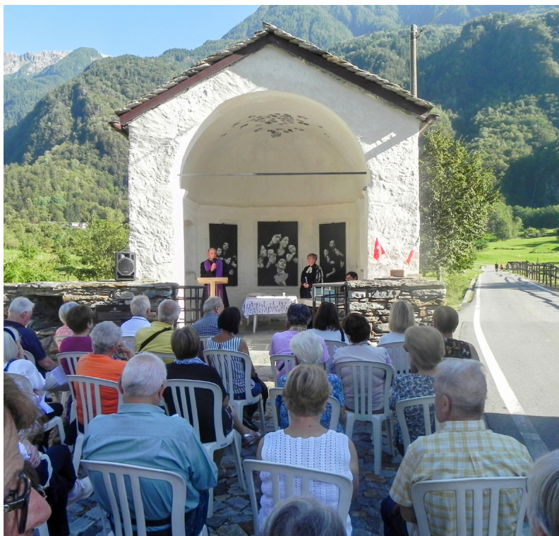
Fig. 9. Preghiera Ecumenica 4 settembre.

tradizione, agli alunni di quarta e quinta della Scuola primaria di Prosto che hanno contribuito a questa edizione con un loro lavoro ispirato alla "Cantina del Piöcc". Un grazie anche alle insegnanti che, pur provenienti da realtà diverse, si appassionano alla nostra storia e si adoperano per farla conoscere ai nostri ragazzi.