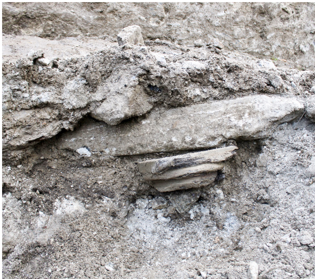
Fig 6. Piuro (SO), Cantina del Piöcc, Area 2000, Settore Gamma, giardino est, capitello con parte di architrave rinvenuto all'interno del crollo e del deposito di frana al di sopra del giardino.

L'ampliamento dello scavo ha permesso di verificare le ipotesi di lavoro dell'anno precedente: siamo in una zona al limite della frana: infatti, il suo deposito diminuisce sensibilmente da nord verso sud e anche da ovest verso est, impattando diversamente sulle strutture che si trovano in diversi gradi di conservazione a seconda della loro posizione.