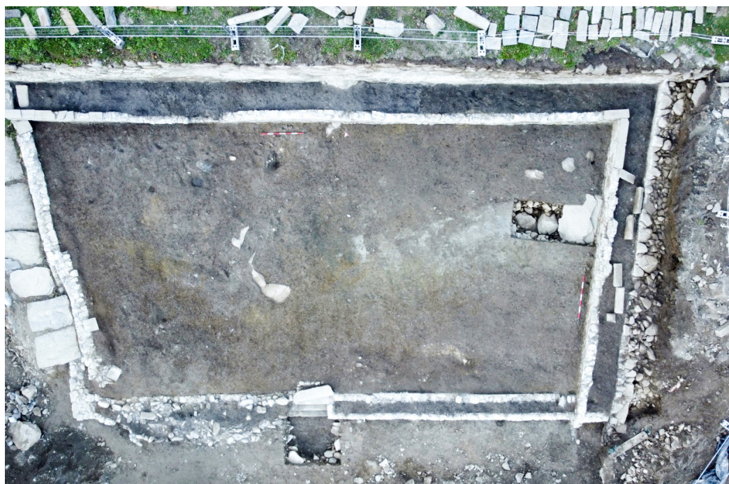
Fig 2. Piuro (SO), Cantina del Piöcc, Area 2000, Settore Gamma, giardino est, vista zenitale.