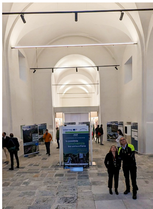
Fig. 14 e 15. Centro grandi Frane Alpine: inaugurazione.

Venerdì, 20 ottobre , inaugurazione a Chiavenna presso la chiesa dell'ex Convento dei Cappuccini, del "Centro internazionale grandi frane alpine" a conclusione del Progetto Interreg Amalpi 1618/2018 sostenuto da Comunità montana Valchiavenna, Regione Lombardia, Canton Ticino, SUPSI, Regione Bregaglia, Regione Moesa, Politecnico e Università Studi di Milano, Università Bicocca, Comune di Piuro e Associazione italo svizzera scavi. Dopo i saluti delle autorità italiane e svizzere, un pubblico numeroso e qualificato ha seguito il convegno che ha visto a più riprese citare la frana di Piuro per la sua drammaticità, ma anche per gli scavi e gli studi che ne sono seguiti, fino a trasformare un evento catastrofico in occasione di ricerca e di interesse turistico culturale. La guida "Amalpi trek", presentata per l'occasione, invita a ripercorrere un itinerario transfrontaliero fra le località coinvolte dalle grandi frane alpine (fig. 14 e 15).