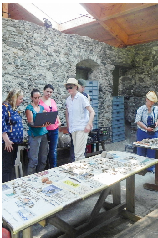
Fig. 6. Visita Belfort reperti Prof. Università di Zurigo.